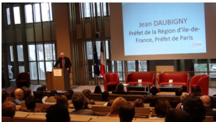
Les assises régionales du tourisme 2014.

L'année 2014 a débuté avec l'organisation des Assises régionales du tourisme qui se sont tenues le 10 février à la Préfecture de la région Ile-de-France.