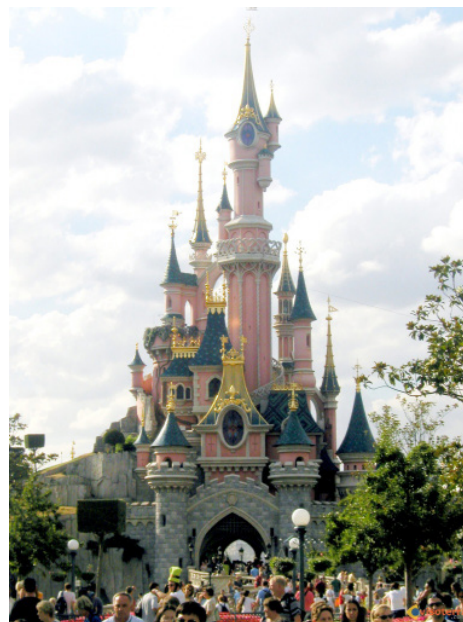
Disneyland Paris, le site le plus visité d'Europe a accueilli 14,2 millions de visiteurs en 2014.

Le tourisme représente 12 492 Md€ d'investissement (2013) et participe au solde positif de la balance touristique à hauteur de 10,3 Md€.