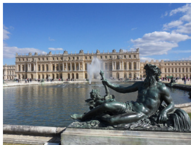
Le château de Versailles.

Il convient néanmoins de relativiser ces chiffres en fonction du volume de la fréquentation de la destination Paris-Ile de France ; c'est ainsi que si les japonais, les russes et les chinois dépensent davantage, ils totalisent ensemble 1 345 000 séjours contre 1 703 000 séjours pour la seule clientèle américaine et 1 260 000 pour la clientèle italienne (l'Ile-de-France comptabilise 24 300 000 séjours en 2013).